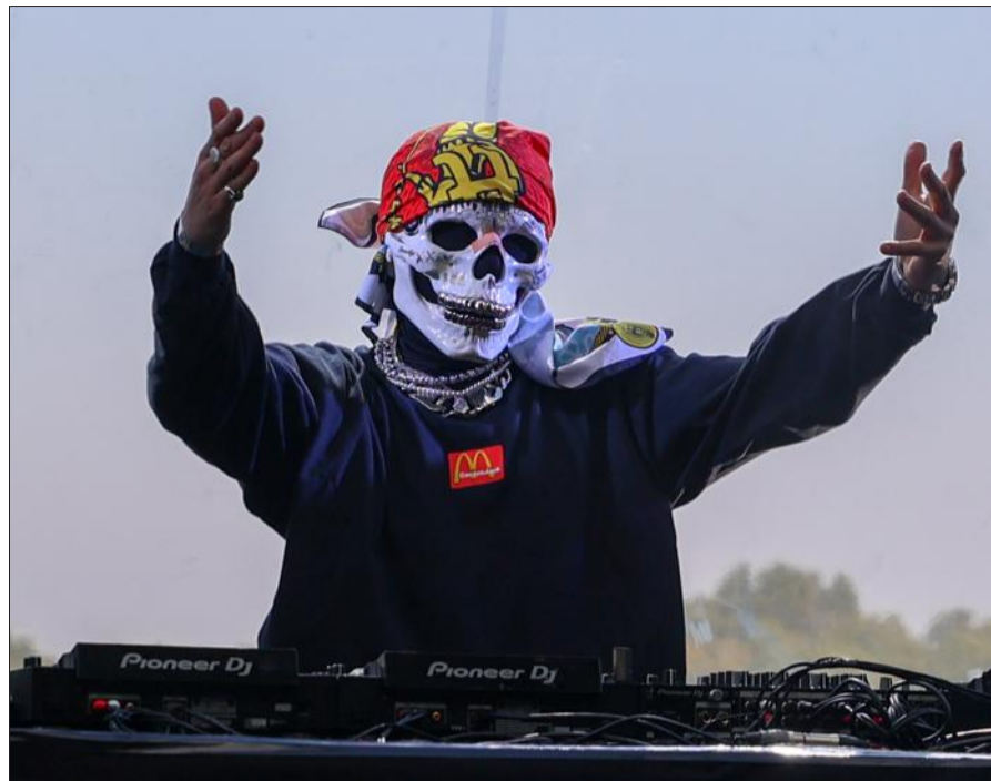
L'inquiétant Vladimir Cauchemar.