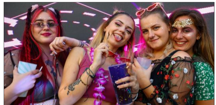
L'esprit festival était bien là.