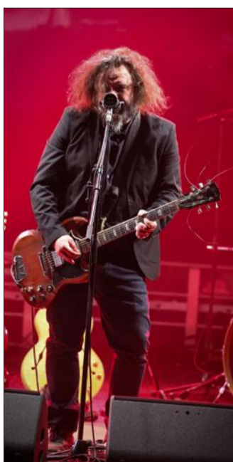
The Inspector Cluzo était sur scène mardi, en ouverture du festival.