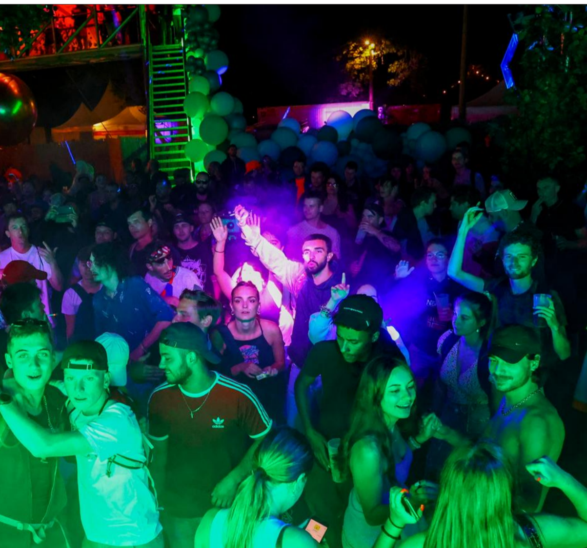
Un samedi soir au Malsaucy. Chaud !

Propos recueillis par Jean-Baptiste POUILLON