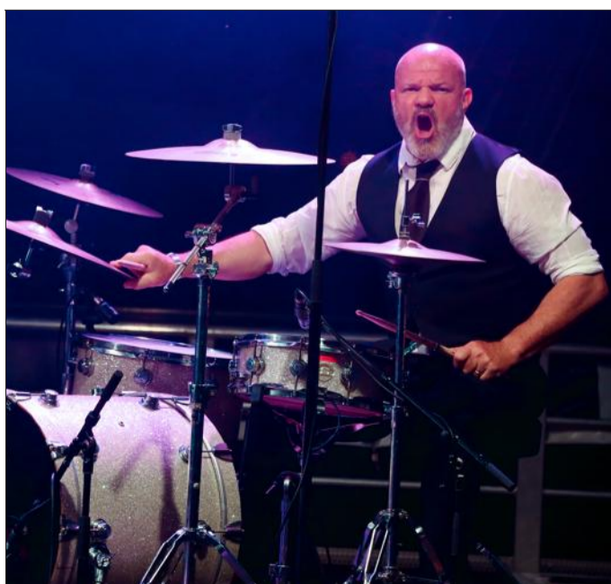
Philippe Etchebest a accompagné The Inspector Cluzo à la batterie.